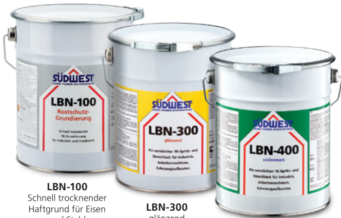
LBN-100 Schnell trocknender Haftgrund für Eisen und Stahl