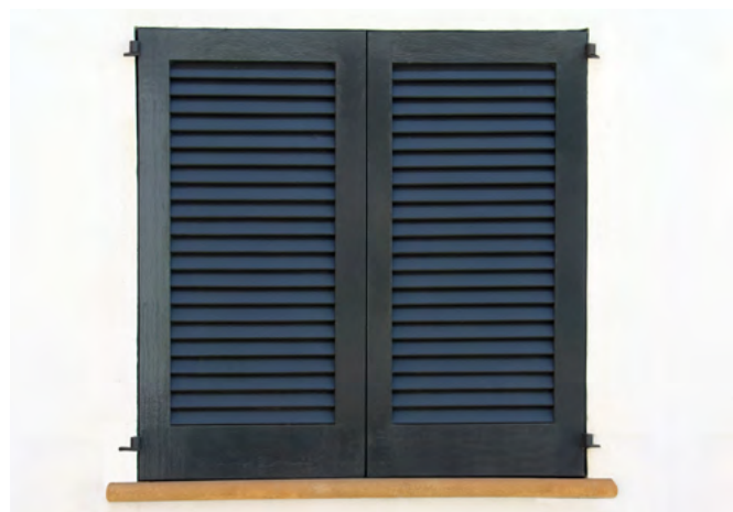
Applikation im Spritzverfahren mit AquaVision® Holzfarbe