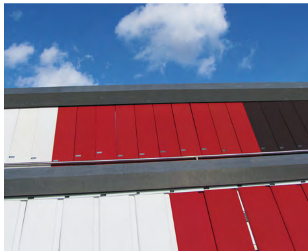
Beste Ergebnisse im Langzeittest auf dem Wetterstand

AquaVision® Holzfarbe bietet hohen Schutz auch bei intensiver Bewitterung. Das Hybrid-Bindemittel garantiert eine sehr gute Kreidungsstabilität, während hochwertige Pigmente für lang anhaltende Farbtonstabilität sorgen. So wird für viele Farbtöne der AquaVision® Holzfarbe die Klassifizierung A1 nach BFS-Merkblatt 26 erzielt. Farbtöne mit dieser Klassifizierung zeichnen sich durch besonders lange Haltbarkeit aus.