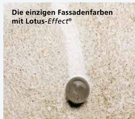
Die einzigen Fassadenfarben mit Lotus-Effect®